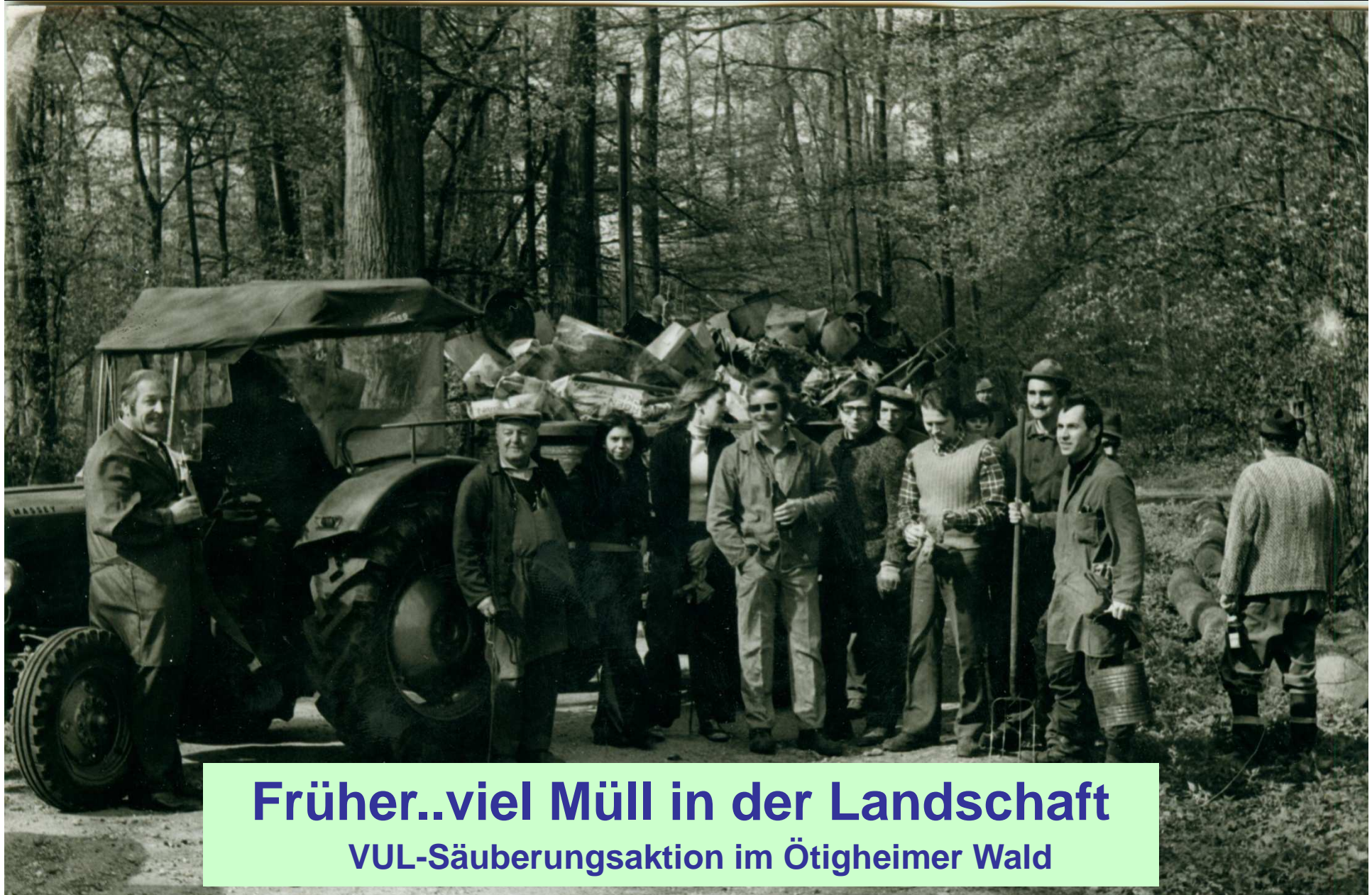
Früher..viel Müll in der Landschaft VUL-Säuberungsaktion im Ötigheimer Wald