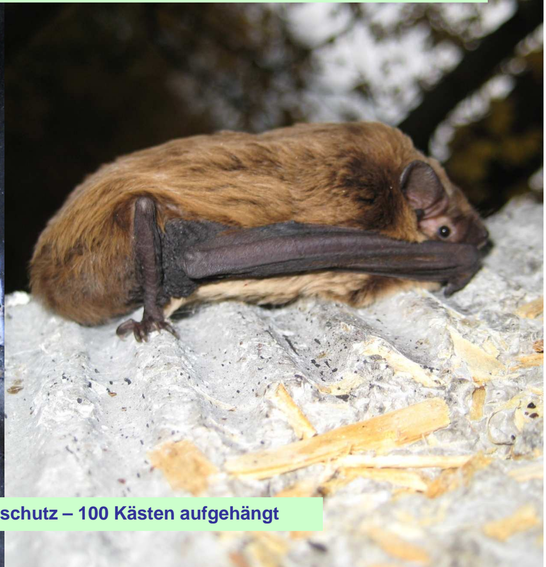
Fledermausschutz – 100 Kästen aufgehängt