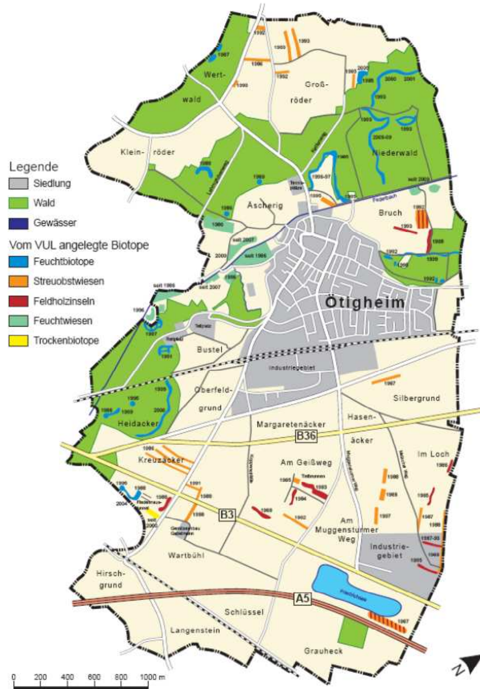
Die Gemarkung Ötigheim mit den vom VUL angelegten Biotopen